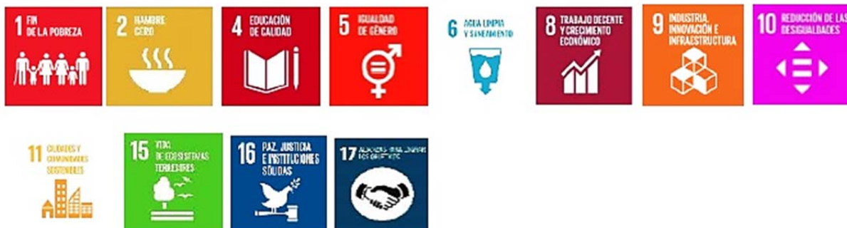
Objetos de Desarrollo Sostenibles ODS para nuestro municipio

Los Objetivos de desarrollo sostenible son el plan maestro para conseguir un futuro sostenible para todos. Se interrelacionan entre sí e incorporan los desafíos globales a los que nos enfrentamos día a día, como la pobreza, la desigualdad, el clima, la degradación ambiental, la prosperidad, la paz y la justicia. Para no dejar a nadie atrás, es importante que logremos cumplir con cada uno de estos objetivos para 2030.